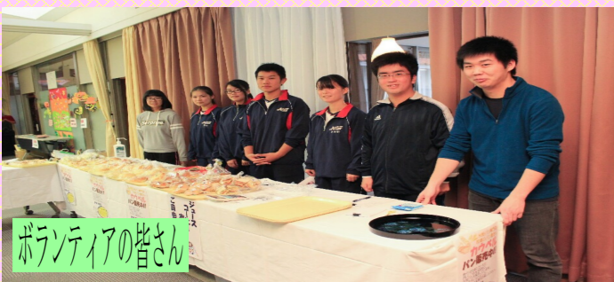
ボランティアの皆さん