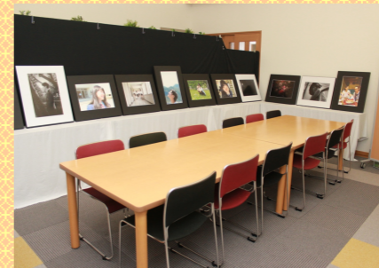
出雲北陵中学・高校 写真部