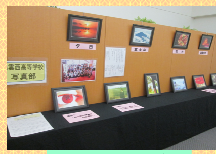
出雲西高校 写真部