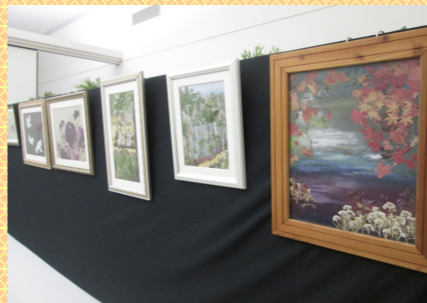
湖陵マゼン 押し花教室