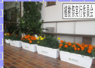
植樹祭実行委員会