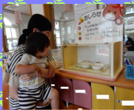
保護者への啓発 (給食・おやつの展示)