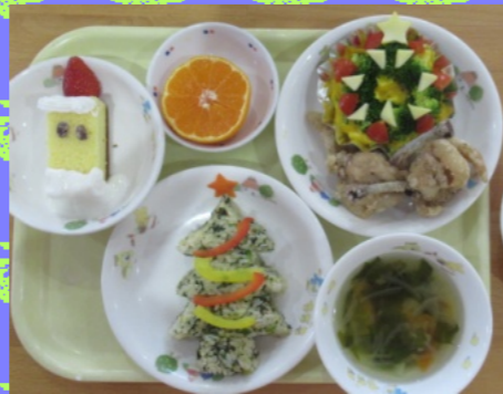
行事食 (クリスマス会)