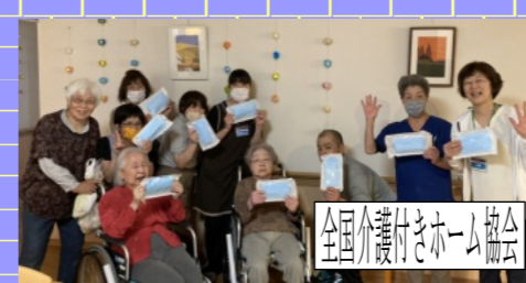
全国介護付きホーム協会