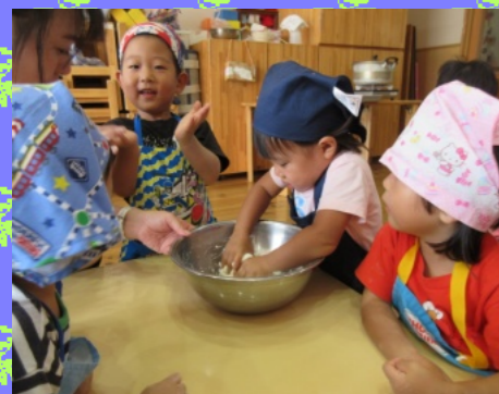
クッキング活動 (お団子作り)