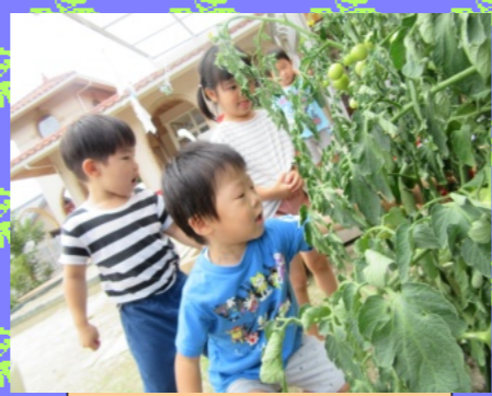
栽培・収穫 (野菜栽培)