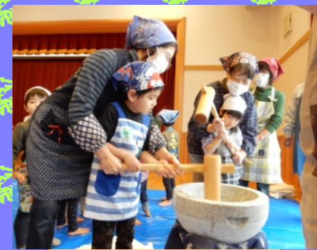
ふれあい活動 (もちつき会)