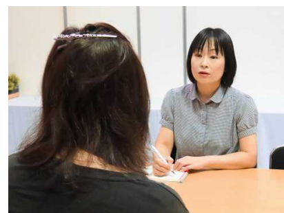
障害者職業生活相談員

少子高齢化により福祉人材の育成が急務となり、採用枠を新卒者だけに限定するのではなく、高齢者・障害者・子育て期間中の女性などにも採用枠を広げていくことが、社会福祉事業を担う当社の責務だと認識したため。