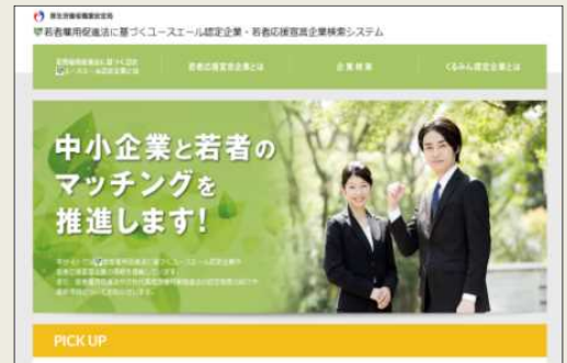
「ユースエール認定企業・若者応援宣言企業検索システム」

個別企業ごとに企業概要、雇用管理の状況、求職者に向けたメッセージなどを掲載することで、積極的な企業情報の発信と若者とのマッチングを促進していきます。