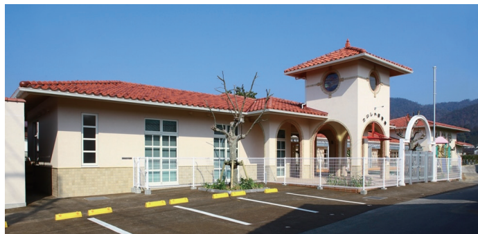
子育て支援事業 たいしゃ保育園