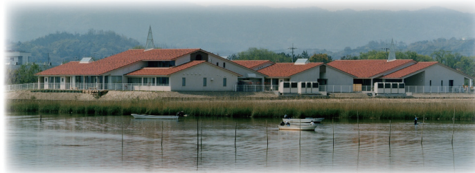
寿光会本部 湖水苑

寿光会本部 住所 〒699-0811 出雲市湖陵町差海318-1 Tel0853-43-8955 Fax0853-43-0995